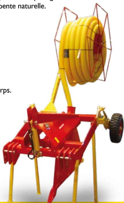
Sous-soleuse DRAINEUSE 1,09 M